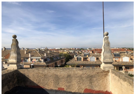
VI-2-3-4-5-6-Vistes des de la torre de l'esquerra de la casa, a la qual s'accedia a través d'una escala exterior