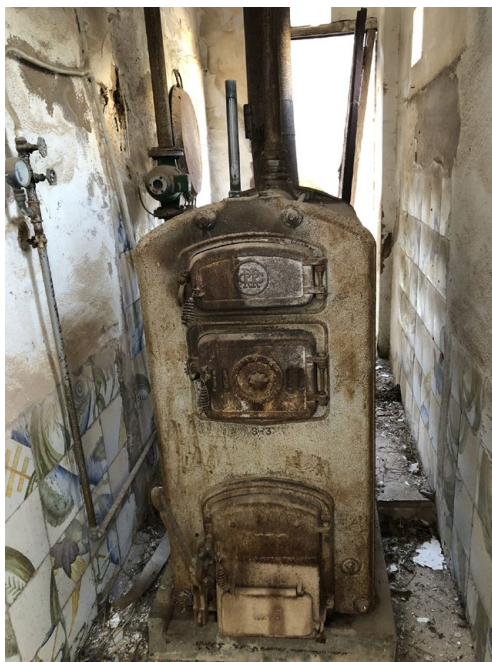
W-Impressionant caldera de llenya que procurava calor a tota la casa i que encara s'hi conserva.