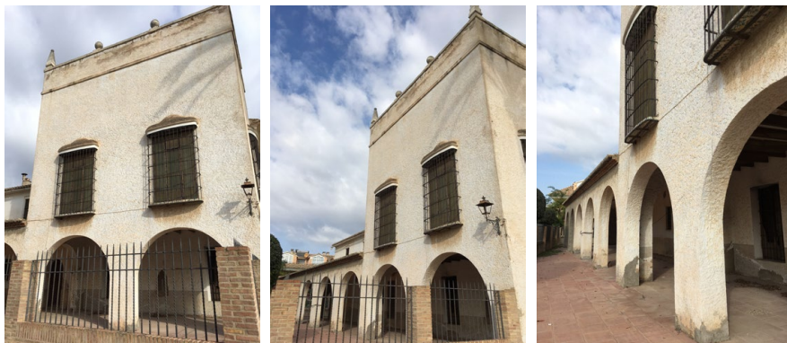
X 1-2-3-Part lateral de la casa porxada per on accedien les residents a l'interior de la casa. Només entrar, a mà dreta hi era una porta que donava accés a la biblioteca-sala de classe. A l'esquerra hi havia un lavabo, la porta que donava a la cuina i altra porta per la qual s'accedia al safareig. Enfront d'aquesta entrada hi havia un accés al menjador.