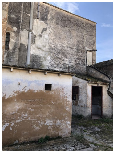
U1-2-3-4-5 -Restes dels estables, de grans dimensions, ubicats en la part posterior de la casa, on realitzaven assajos pràctics d'avicultura i cunicultura.