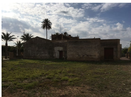
U-6 -Una vista de la part posterior de la casa on s'ubicaven els estables.