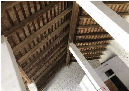
T -Interior del magatzem.

S1-S2 -Façana de l'edifici amb la porta d'accés a la casa d'una sola planta dels estatgers (la més allunyada) i la porta d'accés al magatzem (la primera de les portes, sobre la qual es conserva el nom en taulellets de "Huerto de las Palmas").